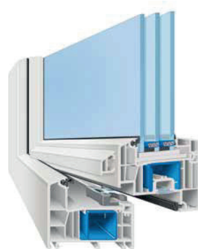
AFINO-one AD (Anschlagdichtungssystem mit zwei Dichtungen)