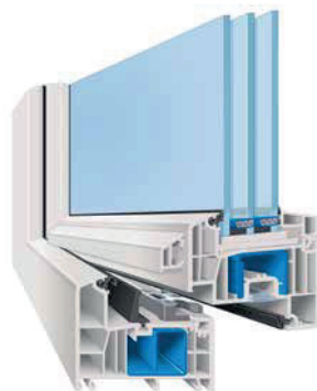
AFINO-one MD (Mitteldichtungssystem mit drei Dichtungen)